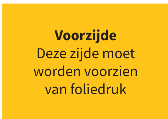
Afb. A: full color

In onderstaand voorbeeld zal er dus alleen folie worden aangelegd op de voorzijde.